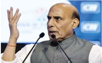
रक्षा मंत्री राजनाथ सिंह

उन्होंने कहा कि यह खेदजनक है कि विपक्ष ऑपरेशन सिंदूर पर सवाल उठा रहा है, जिसमें देश के बहादुर सशस्त्र बलों ने कई आतंकवादी ठिकानों को नष्ट किया। उन्होंने कहा कि इस मौके पर देश के सशस्त्र बलों को श्रद्धांजलि अर्पित करना आवश्यक है। सिंह ने कहा, अतीत में भी यही परंपरा रही है। वर्ष 1971 के युद्ध के दौरान (जब इंदिरा गांधी प्रधानमंत्री थीं), हमारे नेता अटल बिहारी वाजपेयी ने तत्कालीन सरकार का पूरे दिल से समर्थन किया था। उन्होंने यह भी खोजाकर किया कि 1999 में जब कारगिल की घटना हुई थी और वाजपेयी प्रधानमंत्री थे, राजनीतिक और सामाजिक एकता प्रदर्शित हुई थी। उन्होंने कहा, आतंकवाद को हमेशा के